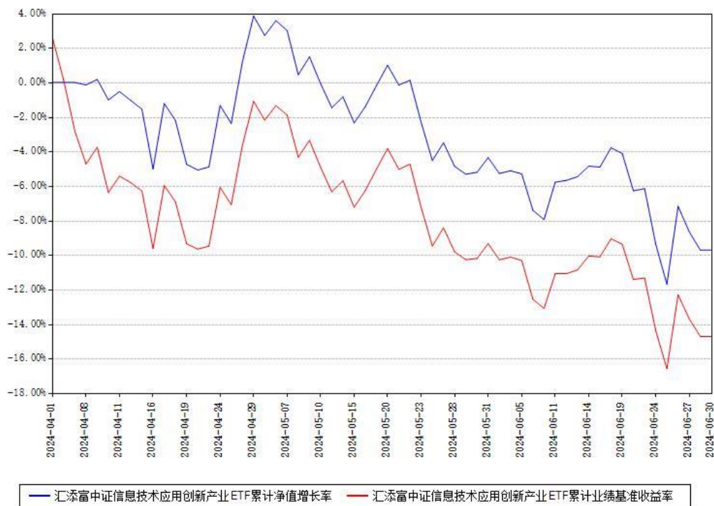
汇添富中证信息技术应用创新产业ETF累计净值增长率与同期业绩基准收益率对比图

(二) 自基金合同生效以来基金累计净值增长率变动及其与同期业绩比较基准收益率变动的比较图