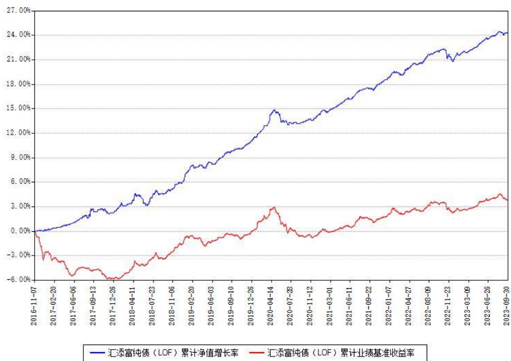
汇添富纯债（LOF）累计净值增长率与同期业绩基准收益率对比图