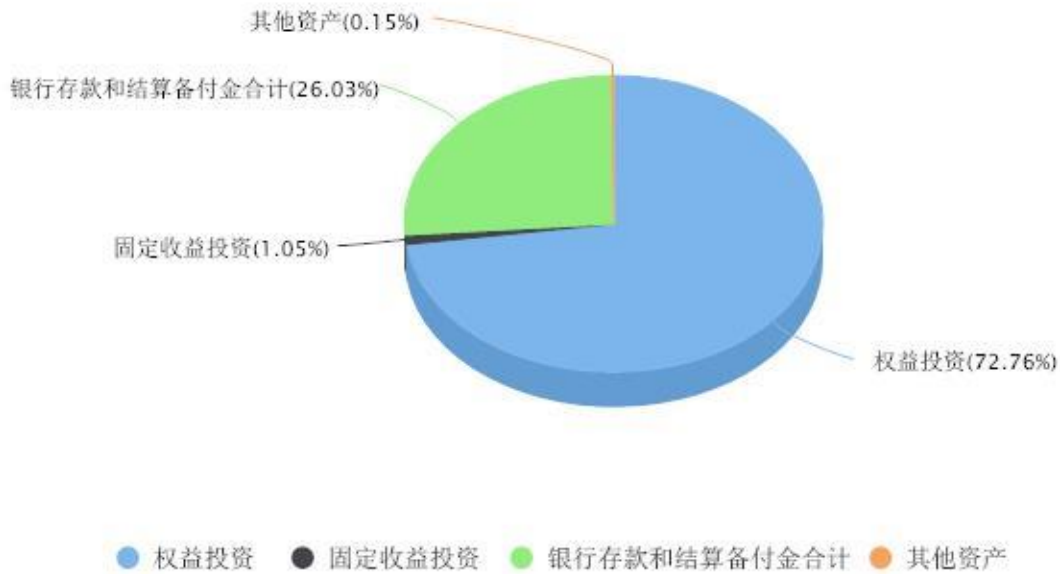
投资组合资产配置图表 数据截止日期:2024年06月30日