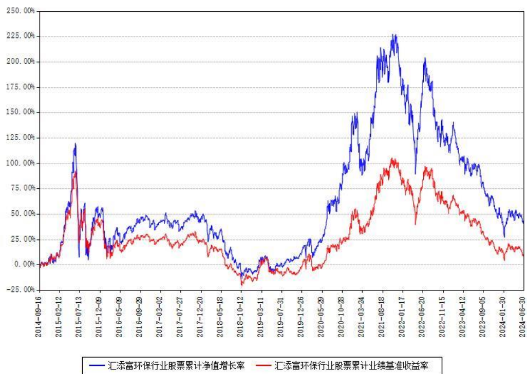
汇添富环保行业股票累计净值增长率与同期业绩基准收益率对比图