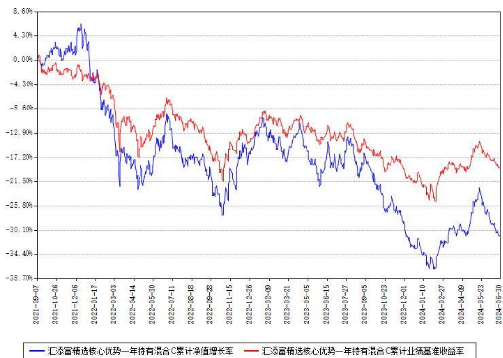
汇添富精选核心优势一年持有混合C累计净值增长率与同期业绩基准收益率对比图