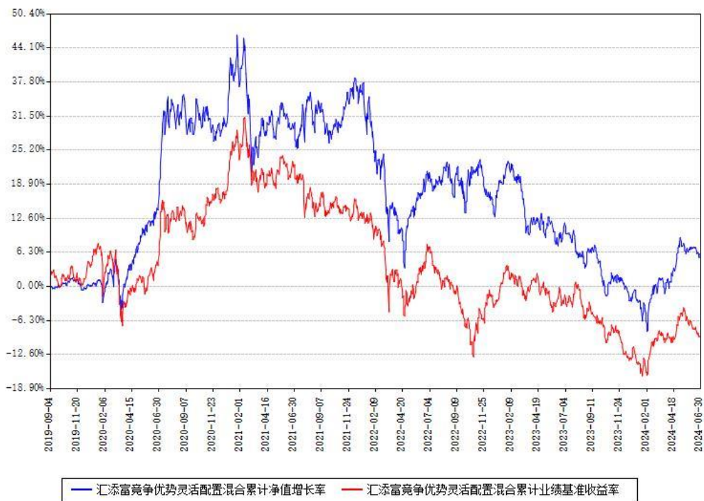
汇添富竞争优势灵活配置混合累计净值增长率与同期业绩基准收益率对比图