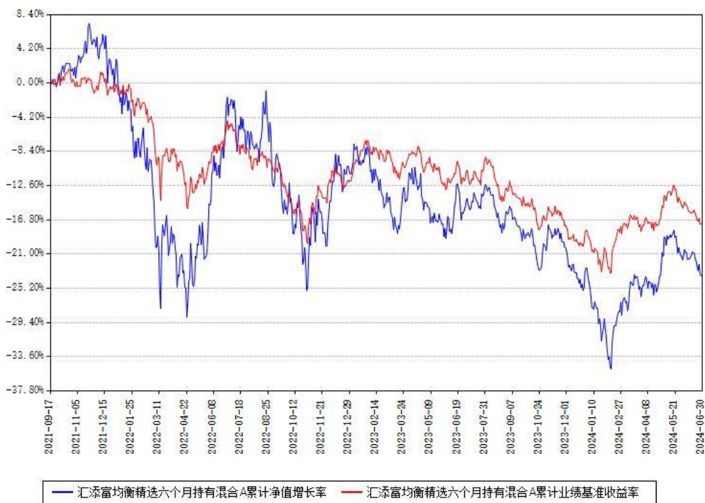
汇添富均衡精选六个月持有混合A累计净值增长率与同期业绩基准收益率对比图