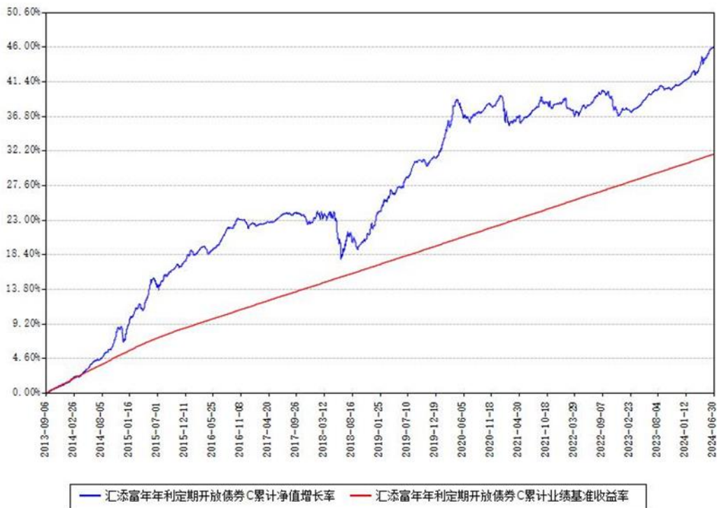
汇添富年年利定期开放债券C累计净值增长率与同期业绩基准收益率对比图