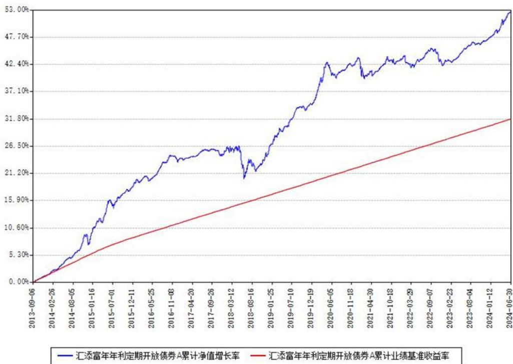
汇添富年年利定期开放债券A累计净值增长率与同期业绩基准收益率对比图