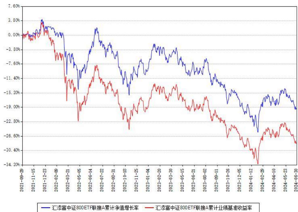
汇添富中证800ETF联接A累计净值增长率与同期业绩基准收益率对比图

(二) 自基金合同生效以来基金累计净值增长率变动及其与同期业绩比较基准收益率变动的比较图