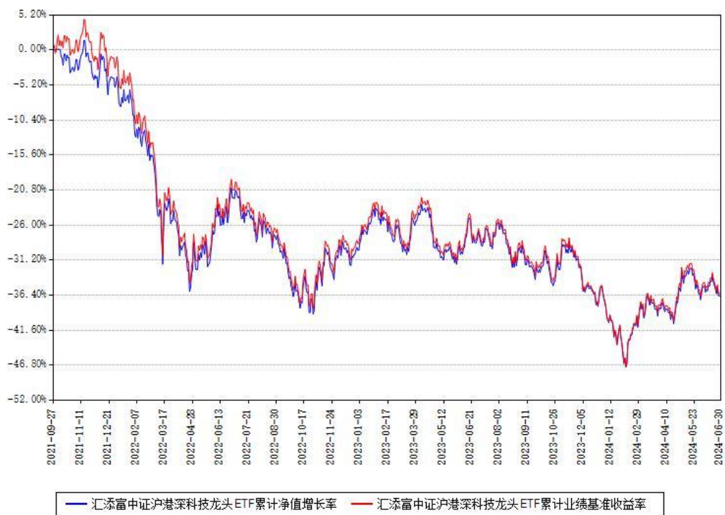
汇添富中证沪港深科技龙头ETF累计净值增长率与同期业绩基准收益率对比图