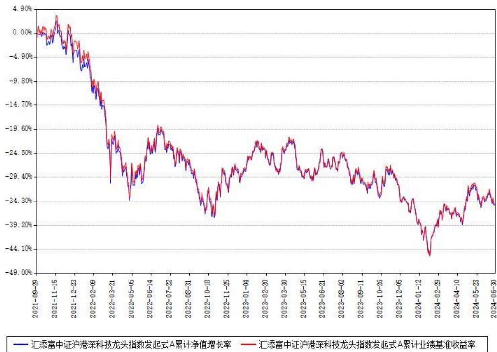
汇添富中证沪港深科技龙头指数发起式A累计净值增长率与同期业绩基准收益率对比图