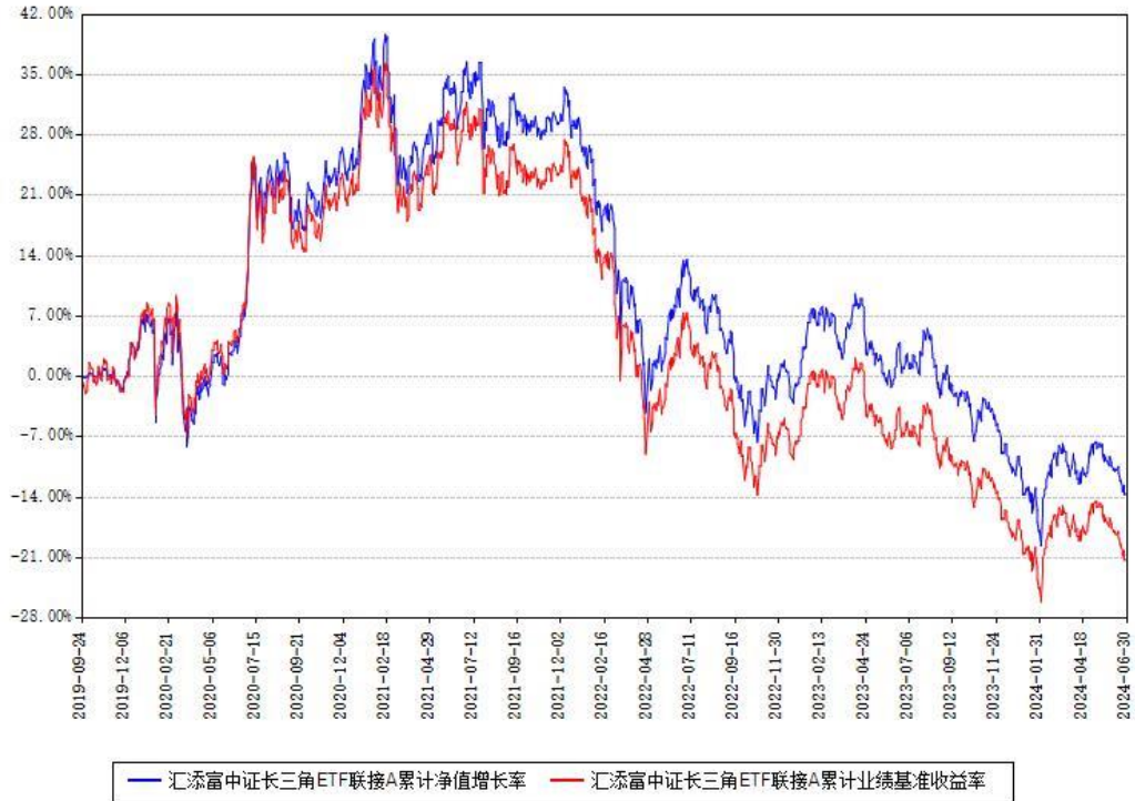
汇添富中证长三角ETF联接A累计净值增长率与同期业绩基准收益率对比图