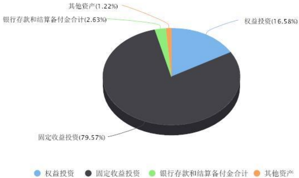
投资组合资产配置图表 数据截止日期:2024年06月30日