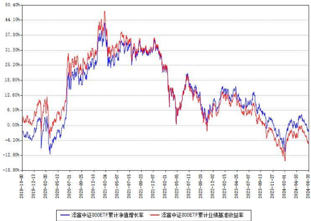
添富中证800ETF累计净值增长率与同期业绩基准收益率对比图