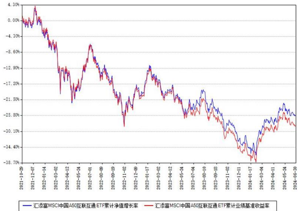
汇添富 MSCI 中国 A50 互联互通 ETF 累计净值增长率与同期业绩基准收益率对比图