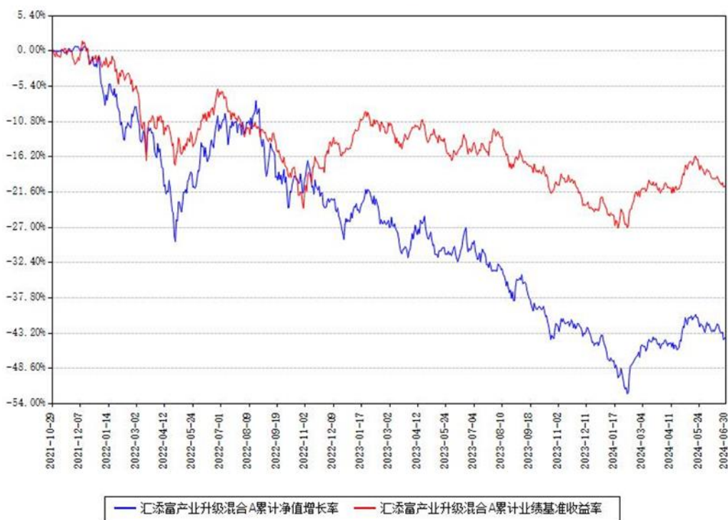
汇添富产业升级混合A累计净值增长率与同期业绩基准收益率对比图

(二) 自基金合同生效以来基金累计净值增长率变动及其与同期业绩比较基准收益率变动的比较图