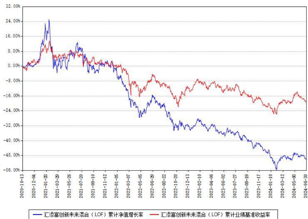
汇添富创新未来混合（LOF）累计净值增长率与同期业绩基准收益率对比图