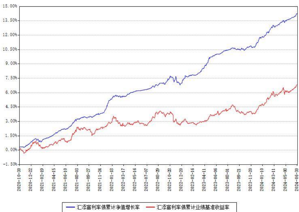
汇添富利率债累计净值增长率与同期业绩基准收益率对比图