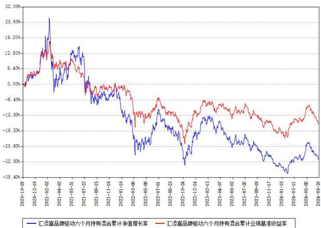
汇添富品牌驱动六个月持有混合累计净值增长率与同期业绩基准收益率对比图