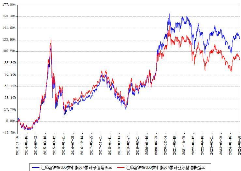
汇添富沪深300安中指数A累计净值增长率与同期业绩基准收益率对比图