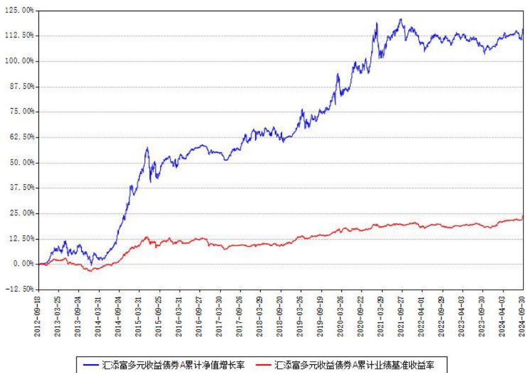
汇添富多元收益债券A累计净值增长率与同期业绩基准收益率对比图