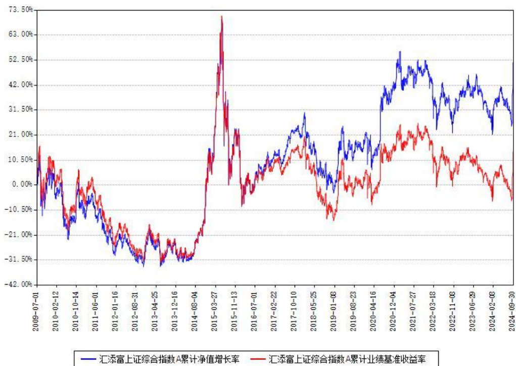
汇添富上证综合指数A累计净值增长率与同期业绩基准收益率对比图