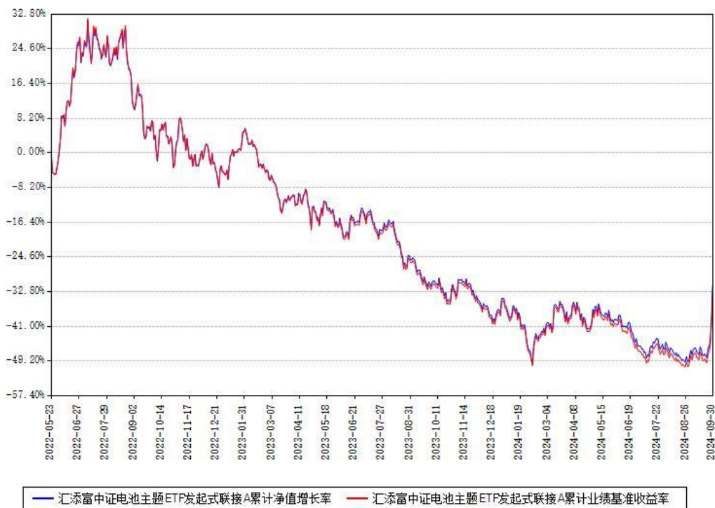
汇添富中证电池主题ETF发起式联接A累计净值增长率与同期业绩基准收益率对比图