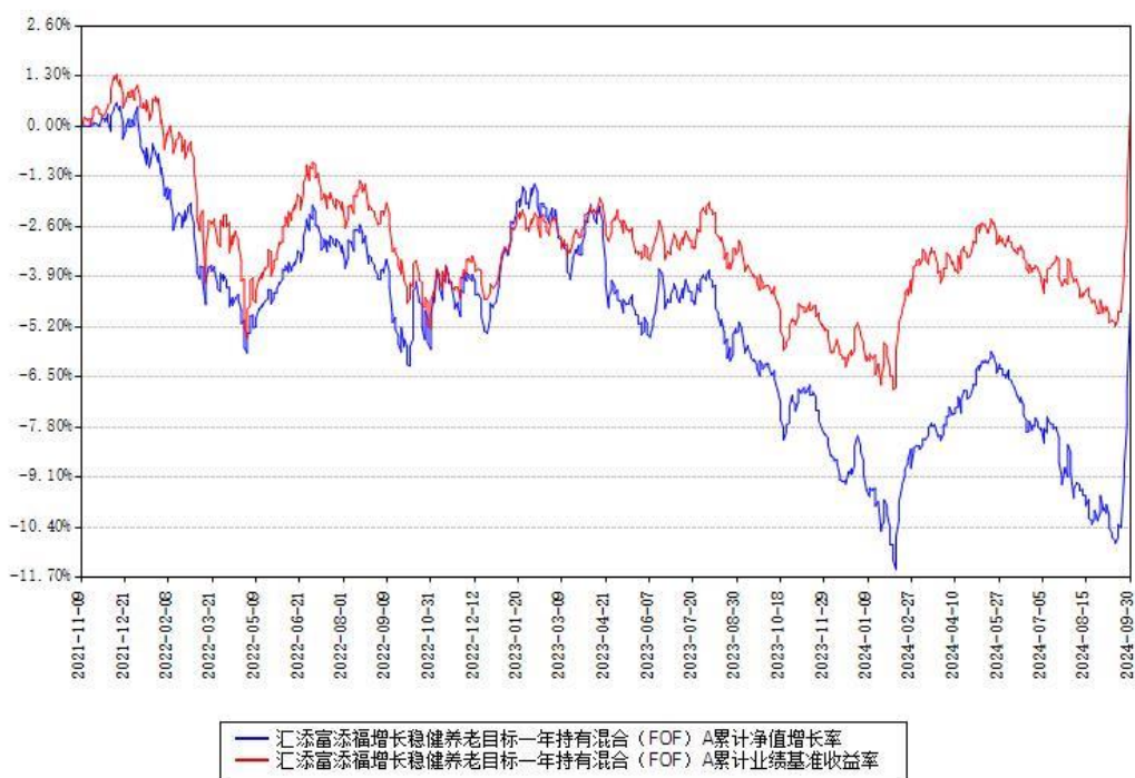
汇添富添福增长稳健养老目标一年持有混合（FOF）A累计净值增长率与同期业绩基准收益率对比图

（二）自基金合同生效以来基金累计净值增长率变动及其与同期业绩比较基准收益率变动的比较图