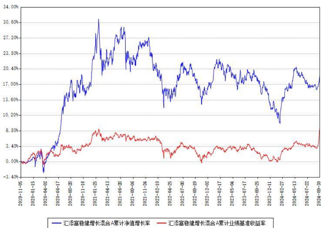
汇添富稳健增长混合A累计净值增长率与同期业绩基准收益率对比图