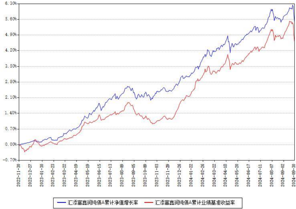
汇添富鑫润纯债A累计净值增长率与同期业绩基准收益率对比图

(二) 自基金合同生效以来基金累计净值增长率变动及其与同期业绩比较基准收益率变动的比较图