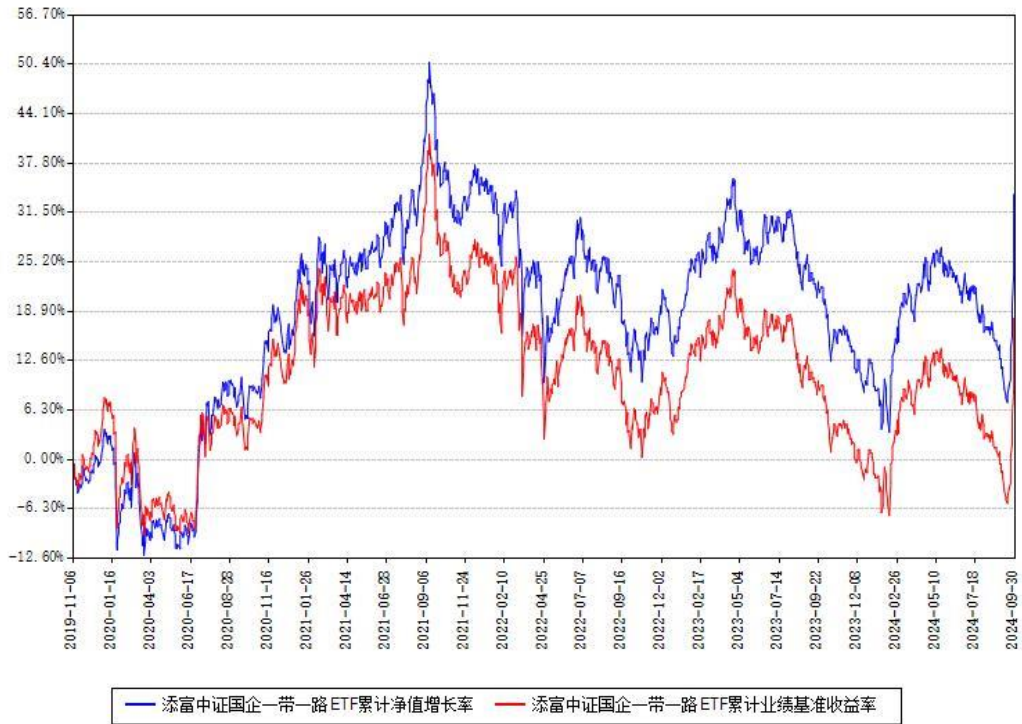
添富中证国企一带一路ETF累计净值增长率与同期业绩基准收益率对比图