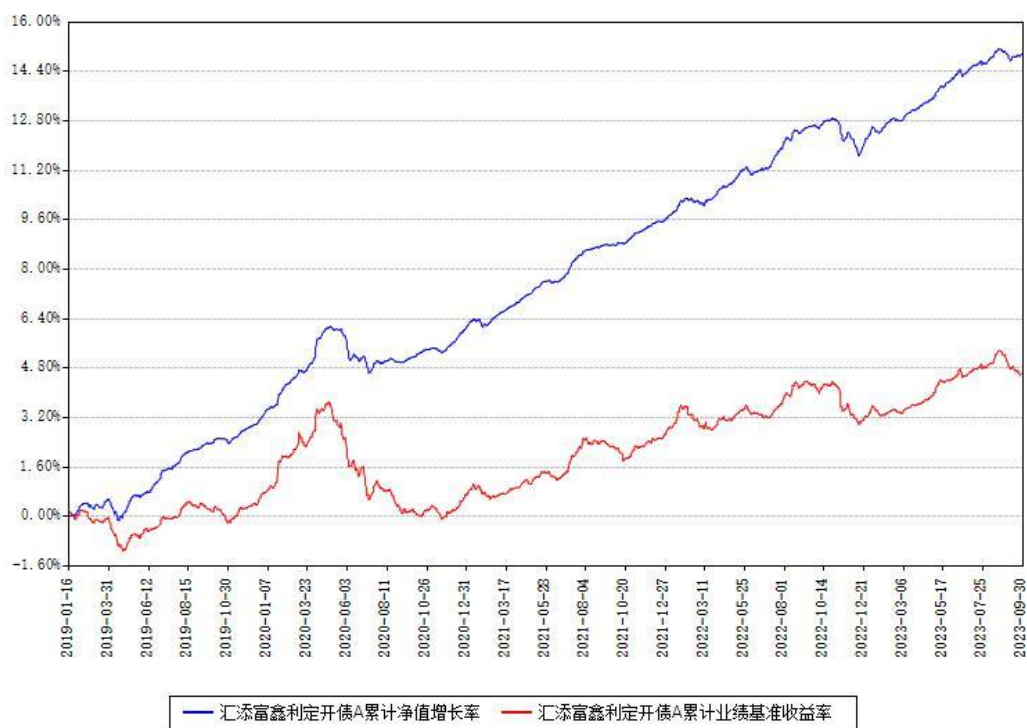
汇添富鑫利定期开债A累计净值增长率与同期业绩基准收益率对比图

(二)自基金合同生效以来基金累计净值增长率变动及其与同期业绩比较基准收益率变动的比较图