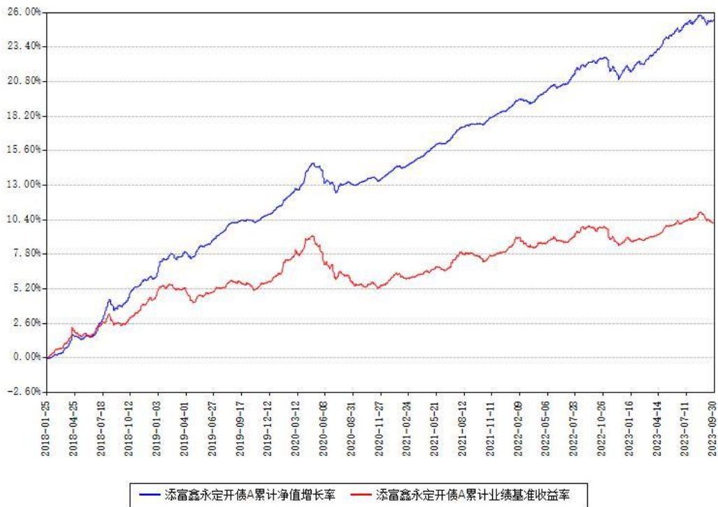
添富鑫永定开债A累计净值增长率与同期业绩基准收益率对比图