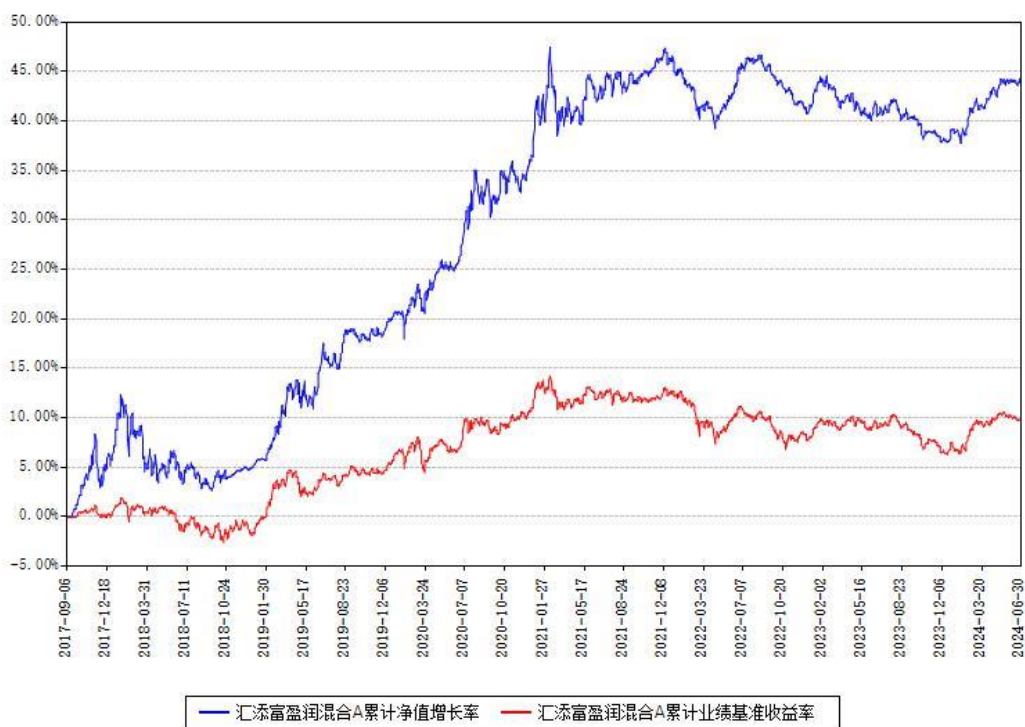
汇添富盈润混合A累计净值增长率与同期业绩基准收益率对比图

(二) 自基金合同生效以来基金累计净值增长率变动及其与同期业绩比较基准收益率变动的比较图