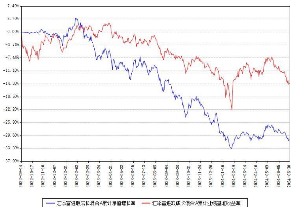
汇添富进取成长混合A累计净值增长率与同期业绩基准收益率对比图