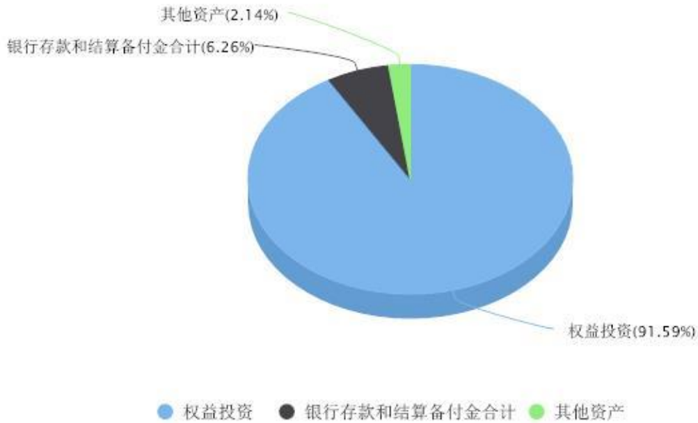
投资组合资产配置图表 数据截止日期:2024年09月30日