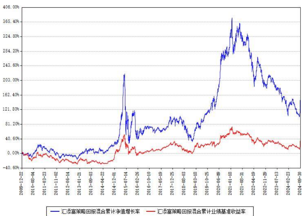
汇添富策略回报混合累计净值增长率与同期业绩基准收益率对比图

(二)自基金合同生效以来基金累计净值增长率变动及其与同期业绩比较基准收益率变动的比较图