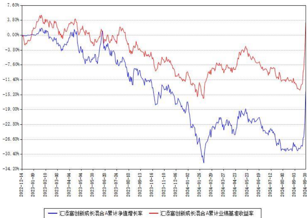
汇添富创新成长混合A累计净值增长率与同期业绩基准收益率对比图

（二）自基金合同生效以来基金累计净值增长率变动及其与同期业绩比较基准收益率变动的比较图