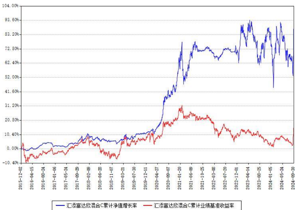
汇添富达欣混合C累计净值增长率与同期业绩基准收益率对比图