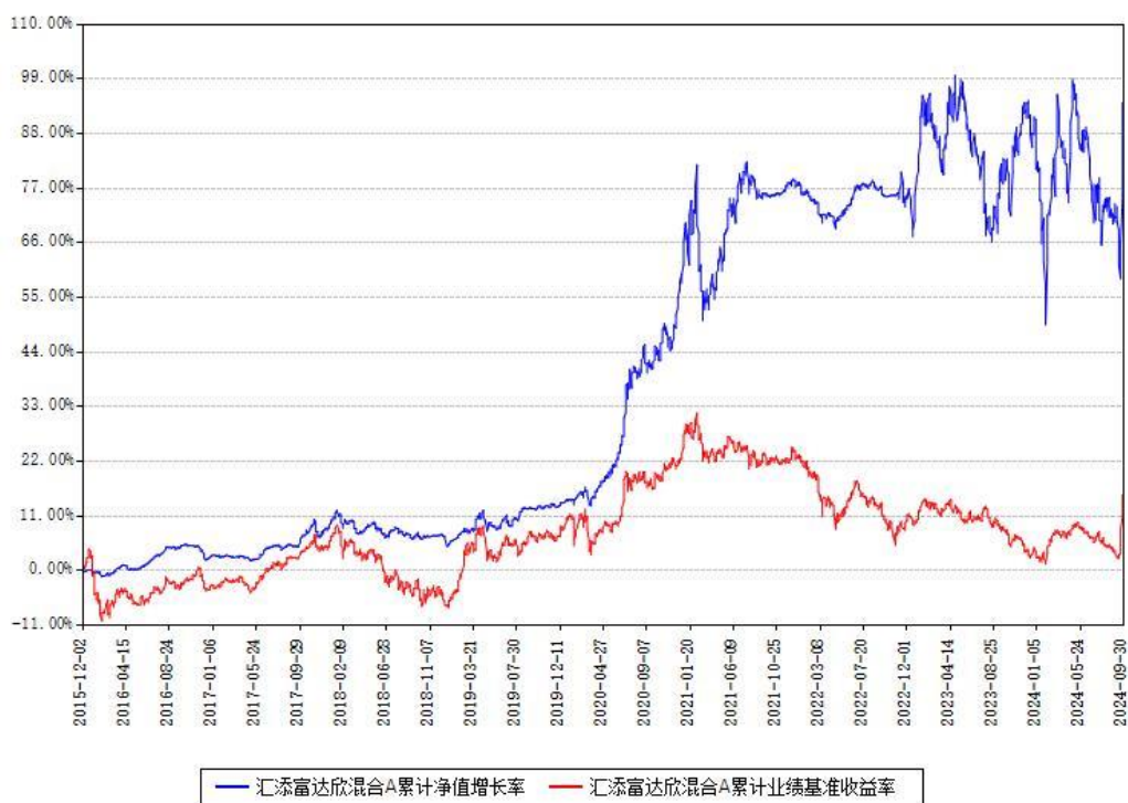
汇添富达欣混合A累计净值增长率与同期业绩基准收益率对比图