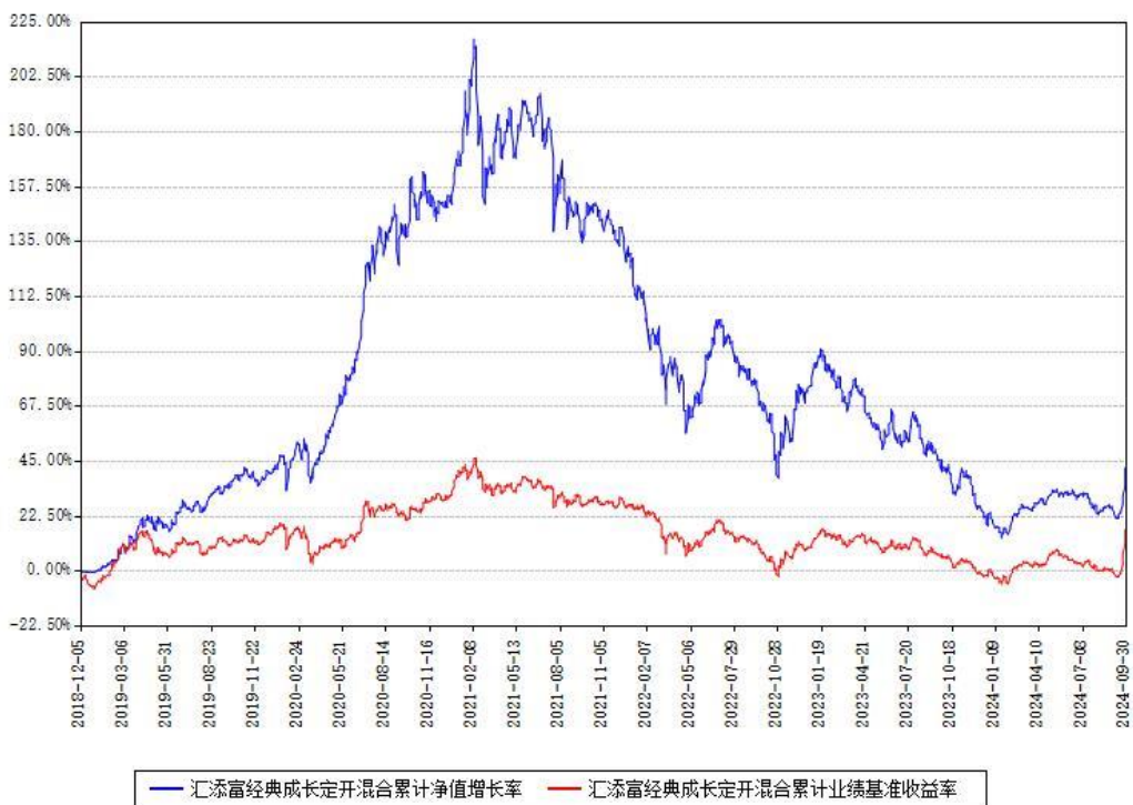
汇添富经典成长定开混合累计净值增长率与同期业绩基准收益率对比图