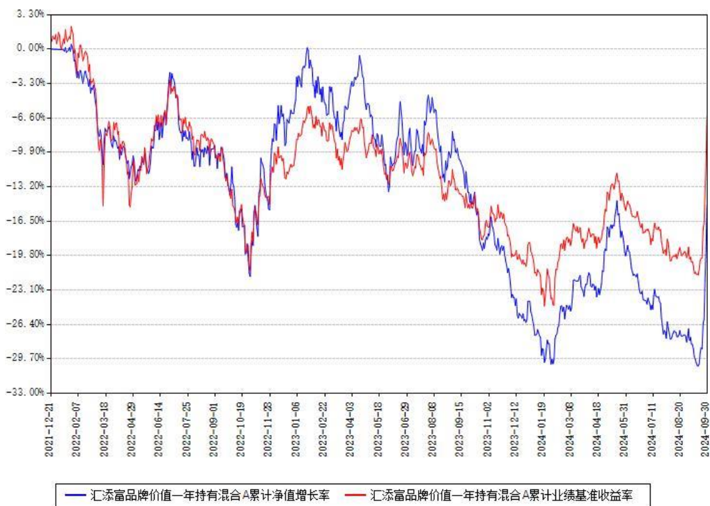
汇添富品牌价值一年持有混合A累计净值增长率与同期业绩基准收益率对比图

（二）自基金合同生效以来基金累计净值增长率变动及其与同期业绩比较基准收益率变动的比较