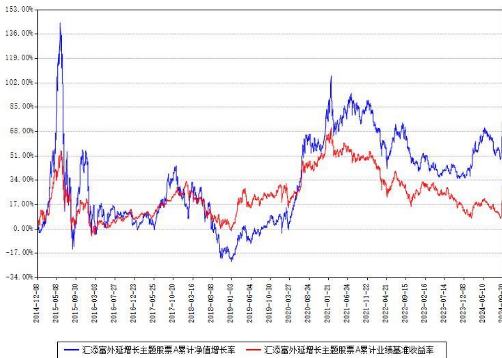
汇添富外延增长主题股票A累计净值增长率与同期业绩基准收益率对比图

(二)自基金合同生效以来基金累计净值增长率变动及其与同期业绩比较基准收益率变动的比较