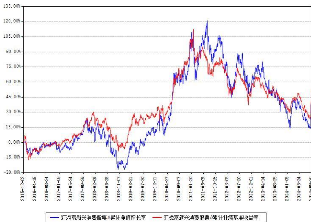
汇添富新兴消费股票A累计净值增长率与同期业绩基准收益率对比图

(二)自基金合同生效以来基金累计净值增长率变动及其与同期业绩比较基准收益率变动的比较图