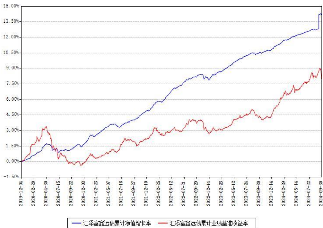
汇添富鑫远债累计净值增长率与同期业绩基准收益率对比图