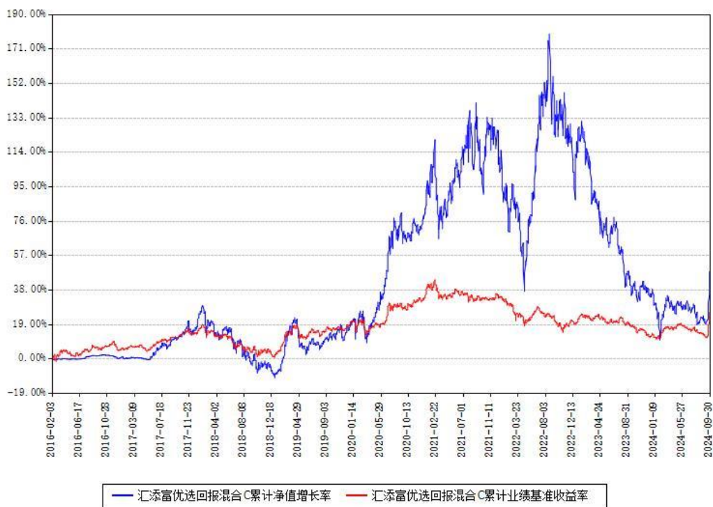
汇添富优选回报混合C累计净值增长率与同期业绩基准收益率对比图