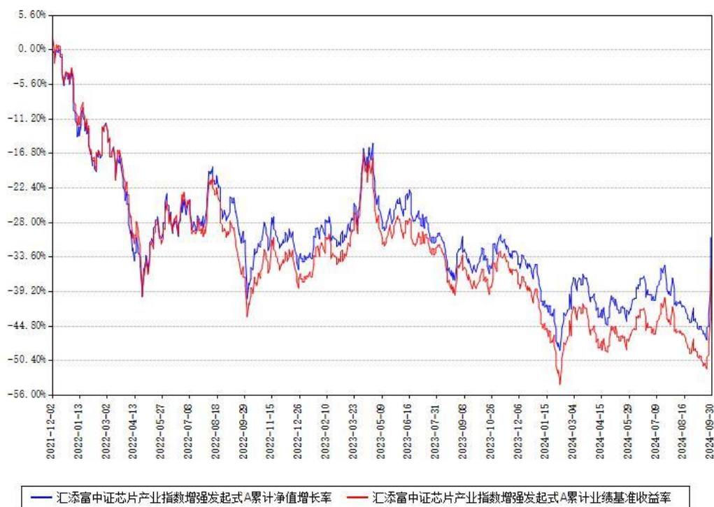
汇添富中证芯片产业指数增强发起式A累计净值增长率与同期业绩基准收益率对比图