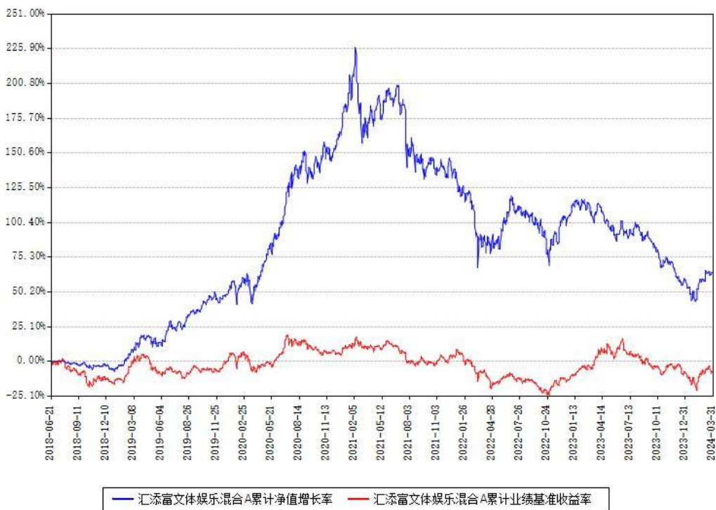
汇添富文体娱乐混合C累计净值增长率与同期业绩基准收益率对比图