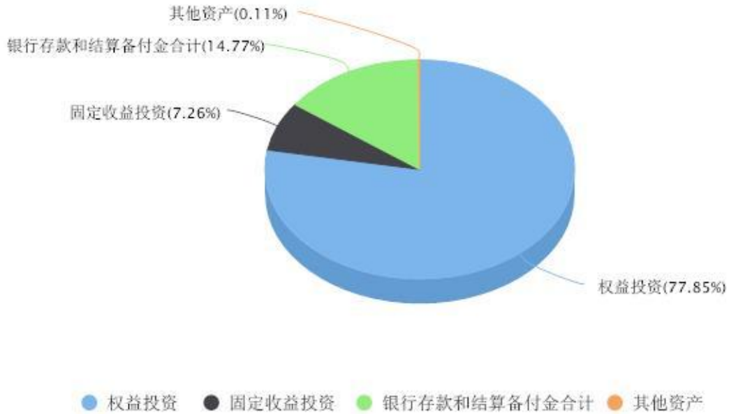
投资组合资产配置图表 数据截止日期:2024年03月31日