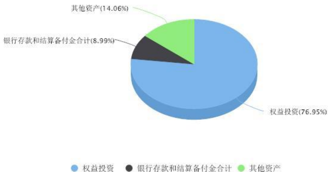
投资组合资产配置图表 数据截止日期:2024年09月30日