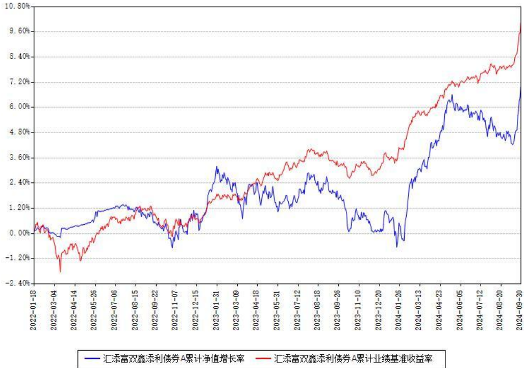
汇添富双鑫添利债券A累计净值增长率与同期业绩基准收益率对比图