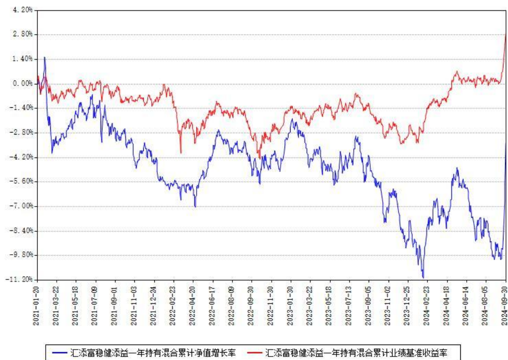
汇添富稳健添益一年持有混合累计净值增长率与同期业绩基准收益率对比图