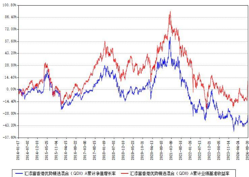
汇添富香港优势精选混合（QDII）A累计净值增长率与同期业绩基准收益率对比图