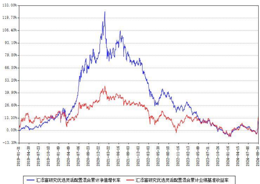
汇添富研究优选灵活配置混合累计净值增长率与同期业绩基准收益率对比图