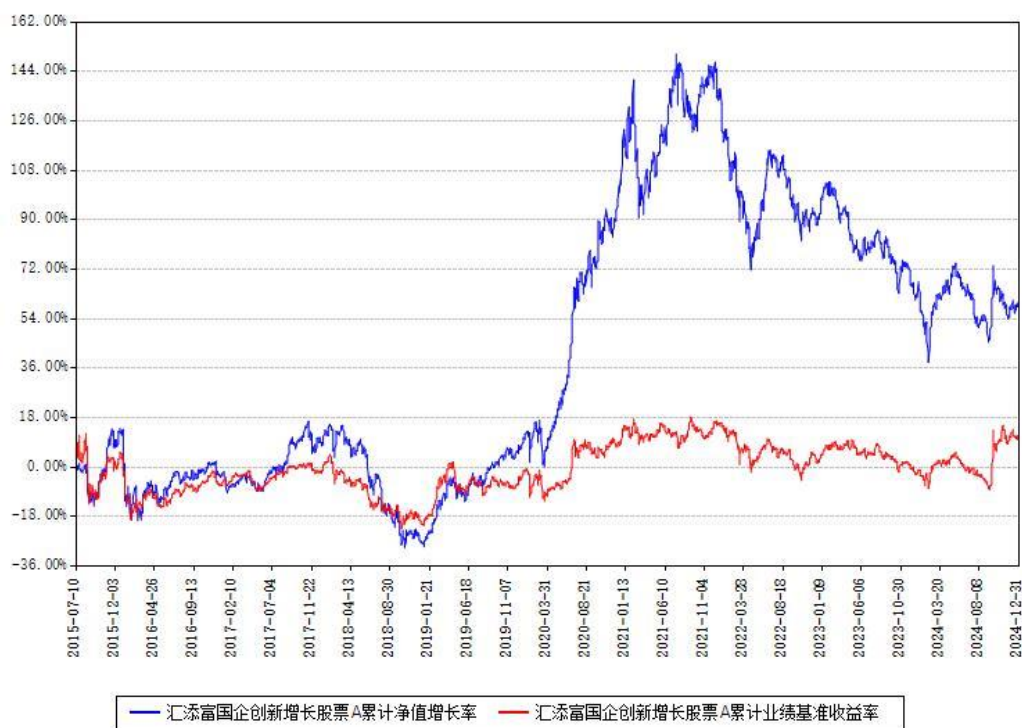
汇添富国企创新增长股票A累计净值增长率与同期业绩基准收益率对比图